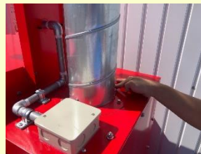
ダクト設置・コーキング処理