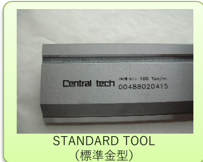
STANDARD TOOL (標準金型)

また、特殊プレスブレーキ用金型製作も行っております。形状の設計や製作を受け賜りますので、お客様のご要望に合わせて特注品も製作可能です。お気軽にご相談ください。