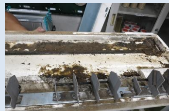
ドレンパンの溜まった汚れ