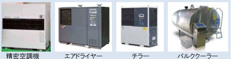
定期点検が必要となる製品の例

皆様、2015年4月から施行された「フロン排出抑制法（改正フロン法）」をご存知でしょうか。これにより、業務用冷凍空調機器（第一種特性製品）簡易点検および定期点検が義務化されました。さらに、一定規模以上の定期点検には専門業者の点検が必須です。具体的には、すべての冷凍空調機器に対して、3ヶ月に1度の簡易点検が義務化されました。また、7.5kw以上の冷凍用圧縮機搭載機器などに関しては、有資格者による1年に1度あるいは、3年に1度の定期点検が必須となります。違反・虚偽があった場合には、管理者への罰則が科せられますのでご注意ください。