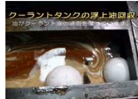
浮上油回収の様子 (Web 動画より)

また、遠心分離機と異なり、イニシャルコストも抑えられ、メンテナンスはほとんど不要です。さらに、電気を使わないエア駆動ですから、カプラがあれば簡単に接続できます。電圧も関係ありませんので、国内外限らず簡単に搭載できる事もメリットですね！あるお客様の事例では、マシニングセンタ 20 台分のクーラント液の寿命が飛躍的に伸び、年間 100 万円のコスト低減が実現した実績があります！ちなみに、この『エコイット』は、某自動車メーカーの工場では既に数百台稼働中と、大変ご好評をいただいている商品です！デモ機を無料でレンタルしておりますので、お客様のもとでも是非一度お試しください。