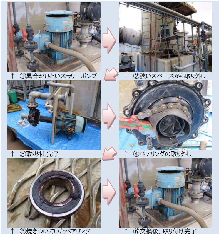
↑ ①異音がひどいスラリーポンプ

マニアクで修理が難しそうな設備機器では、業者からお断りされることも多くなりますよね。SNGでは、独自のネットワークを活用して、お客様のお困り工事を何とかして解決します！そこで今回は、スラリーポンプの修理事例のご紹介です。このスラリーポンプは、異音が悪いくらいということで修理のご要望がありましたが、断る業者が続出しました。そこで、弊社が対応できる修理会社を見つけ出して工事を請け負いました。まずは、狭いスペースから問題のポンプの取り出し、原因と思われるベアリングを確認すると、やはり見事に焼きついていました。ベアリングを交換すると、異音はおさまり正常に作動したため、元通りに設置し修理完了となりました。お断りされる様な困った工事案件も、SNGへご相談下さい！