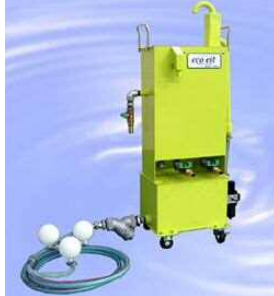
浮上油回収装置『エコイット』

工作機械をご使用のお客様、ご存知でしたか？クーラントタンクなどに浮かぶ泡立った浮上油、これには金属粉などの微細スラッジが含まれており、実は切削加工の能率を下げ、ワークの表面精度を悪化させている要因にもなっています。今回ご紹介します新型浮上油回収装置『エコイット』では、一時間当たりの処理能力が300Lと、ベルトスキマーの数十倍の能力がございます。