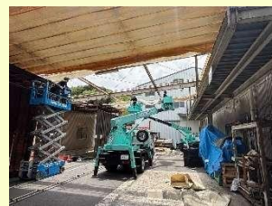
古いシートの撤去