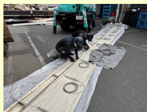
新しいシートの調整