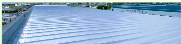
次世代の遮熱シート『サーモバリア』

近年、夏場の気温が上昇し、製造現場での熱中症リスクは年々高まっています。これを受けて、2025年6月1日から労働安全衛生規則が改正され、職場における熱中症対策が法的に義務化されました。「熱中症対策、何から始めればいいのか悩んでいる…」今回はそんな課題がある方に最適な遮熱シート『サーモバリア』をご紹介します。当製品は、高純度なアルミ箔を使用しており、太陽から放射される 輻射熱をなんと97%もカット し、室内の温度上昇を抑制！さらに、特許取得「スカイ工法」なら、屋根の上から貼るだけで 作業を止めずに施工が可能 ！是非、今夏の暑さ対策として導入をご検討ください！