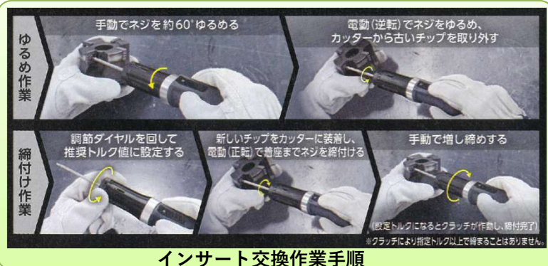
インサート交換作業手順