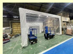
帆布据付・仕上げ