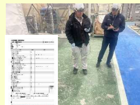
試運転・風速測定

局所排気装置の設置・変更時には、工事開始の30日前までに労働基準監督署に届け出ることが労働安全衛生法によって義務付けられています。当社ではこれらの法令に則した最適なサポートを行います！