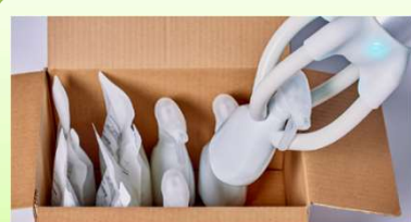
『ソフトロボットハンド』

「過去に、ピッキングロボットの導入検討をしたが、箱型商品のみしか掴むことができず、結局導入を断念した…」今回はこのようなピッキングにおけるワーク把持のお悩みを解決するブリヂストン製の「ソフトロボットハンド」をご紹介します。当ロボットハンドは、ブリヂストンの最新技術であるゴム人工筋肉「ラバーアクチュエーター」を用いることで、 柔らかいモノから重いモノ、形が変形するモノ まで、多種多様なワークを問題なく掴むことができます。具体的にどんなワークまで対応できるのか、下記動画よりご確認ください！