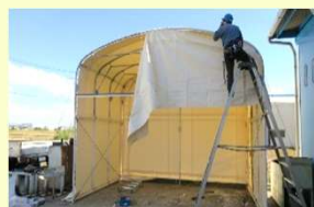
新しいシートの取り付け