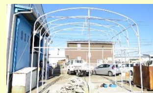
古いシートの取り外し