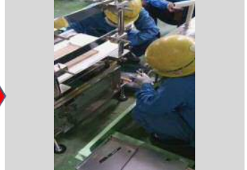
↑ ④駆動電源配線作業