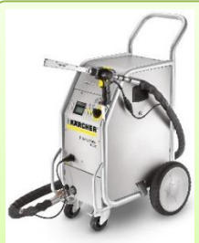
「ドライアイスブラスター」

こちらは、ケルヒャー製のドライアイスブラスター『IB 7/40』です。当製品は、その名の通り、水等を使用せず、ドライアイスを使用して、汚れを落とす洗浄機です。ドライアイスは対象物にぶつかった後、一瞬で気化するため、対象物が濡れることはありません。そのため、水気を嫌う機器、設備、作業場であっても、使用することが可能です。