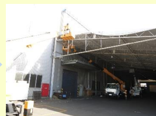
新規テントシートの設置