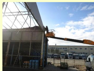
既設テントシートの撤去