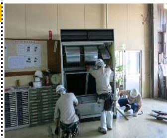
↑⑤据付完了・利用説明