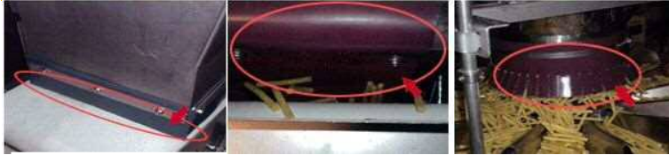
ホッパーのこぼれ防止 製品破損防止クッション 飛散防止