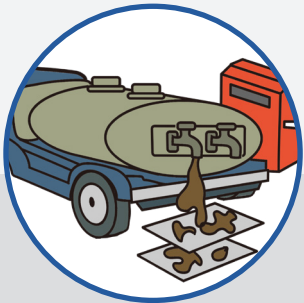
タンクローリーなどの濁油