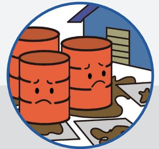
ドラム缶下に敷くマットとして