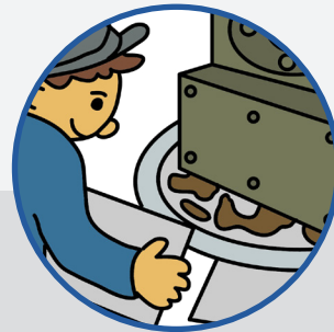
機械周辺の水や油の吸い取り