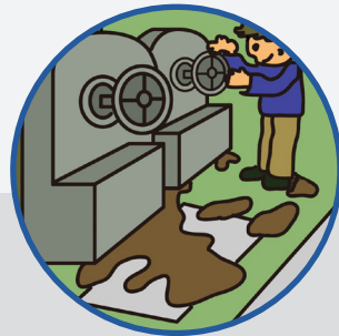
工場内のマットとして