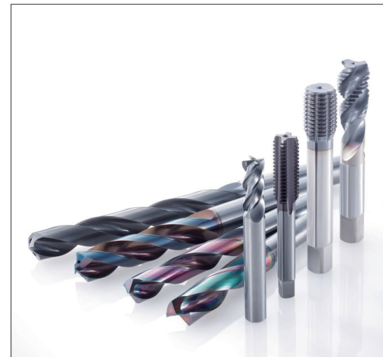
第84回 回転工具の基礎知識