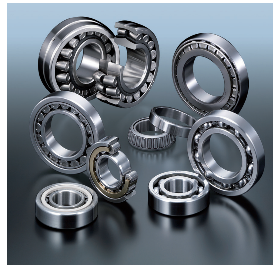
第83回 ベアリングの基礎技術